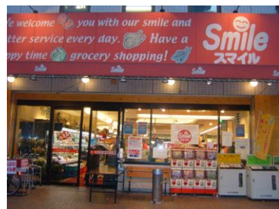
食の生活館スマイル ／北九州市戸畑区中本町3番2号