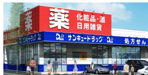
サンキュードラッグ社ノ木薬局 ／北九州市門司区社ノ木1丁目16-6

今後もサンキュードラッグは地域密着企業として、お客様1人1人にお役に立てるように、そして環境問題に少しでも貢献できればと考えております。