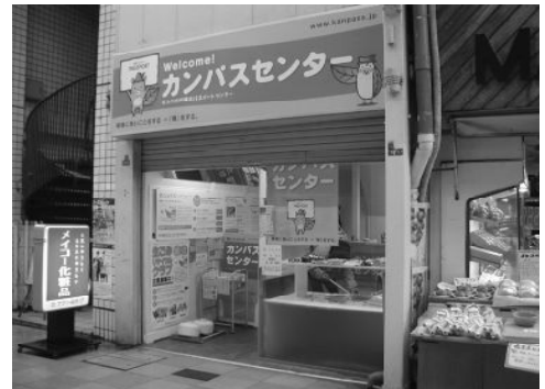
若松明治町銀天街カンパスサブセンター

若松明治町 北九州市若松区本町2-10-11 銀天街 10:00～17:30 (土日祝除く)