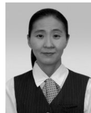
ベスト電器 八幡本店 副店長