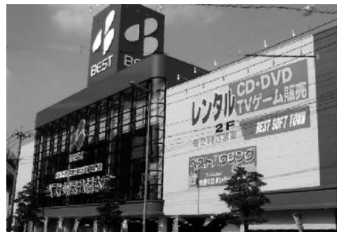
ベスト電器八幡本店 ／北九州市八幡東区東田2-1-15

八幡本店は“平成19年度省エネ型製品普及推進優良店”を経済産業省より受賞しており優良店として、また家電業界に携わっている企業として省エネ型家電製品を一人でも多くのお客様に販売アドバイスできるよう、今後もベスト電器は環境問題へのお役に立てればと考えております。