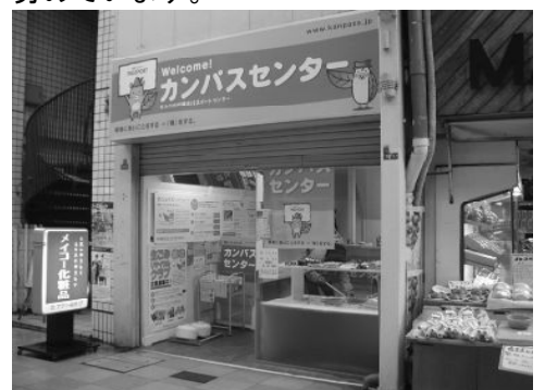
若松明治町銀天街カンパスサブセンター

エコタウンのある「若松」、さすがに環境に関心を持っている人が多く、カンパス事業に協力的な会員さん共々「環境の和」を広げて行きたいと日々の活動に努めています。