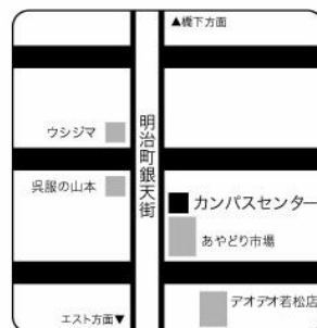
若松明治町 北九州市若松区本町2-10-11 銀天街 10:00～17:30 (土日祝除く)