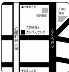
八幡祇園町 北九州市八幡東区祇園2-1-9 銀天街 11:00～17:00 (土日祝除く)